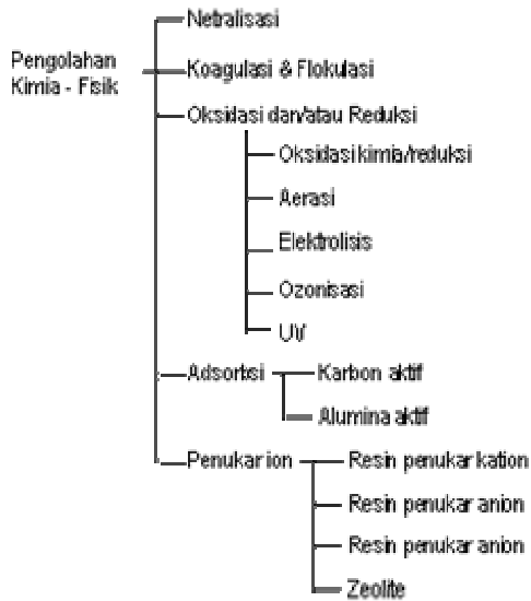
Gambar 2. Skema Diagram pengolahan Kimiawi

Pengendapan bahan tersuspensi yang tak mudah larut dilakukan dengan membubuhkan elektrolit yang mempunyai muatan yang berlawanan dengan muatan koloidnya agar terjadi netralisasi muatan koloid tersebut, sehingga akhirnya dapat diendapkan. Penyisihan logam berat dan senyawa fosfor dilakukan dengan membubuhkan larutan alkali (air kapur misalnya) sehingga terbentuk endapan hidroksida logam-logam tersebut atau endapan hidroksiapatit. Endapan logam tersebut akan lebih stabil jika pH air > 10,5 dan untuk hidroksiapatit pada pH > 9,5. Khusus untuk krom heksavalen, sebelum diendapkan sebagai krom hidroksida [\text{Cr}(\text{OH})_3] , terlebih dahulu direduksi menjadi krom trivalent dengan membubuhkan reduktor ( \text{FeSO}_4 , \text{SO}_2 , atau \text{Na}_2\text{S}_2\text{O}_5 ).